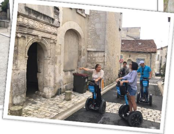
Balade commentée en Gyropode