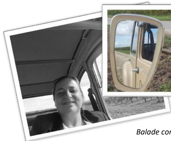
Balade commentée en voiture vintage